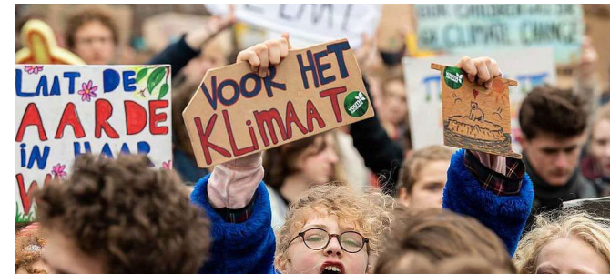
Uit Greenpeace Nederland

6 Kleurrijke samenleving. PPe streeft naar een open samenleving waar acceptatie, solidariteit gelijkwaardigheid, veiligheid en respect de omgangsnormen zijn. Wij zijn fel tegen uitsluiting en discriminatie op welke grond dan ook. Eindhoven is een internationale stad, waar vele mooie culturen samenkomen.